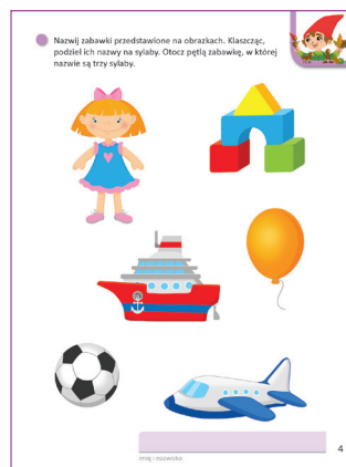
Karty pracy, karta 4