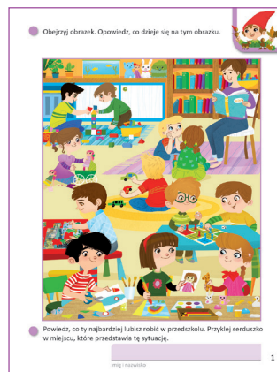
Karty pracy, karta 1