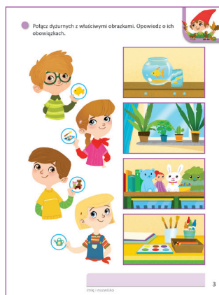
Karty pracy, karta 3