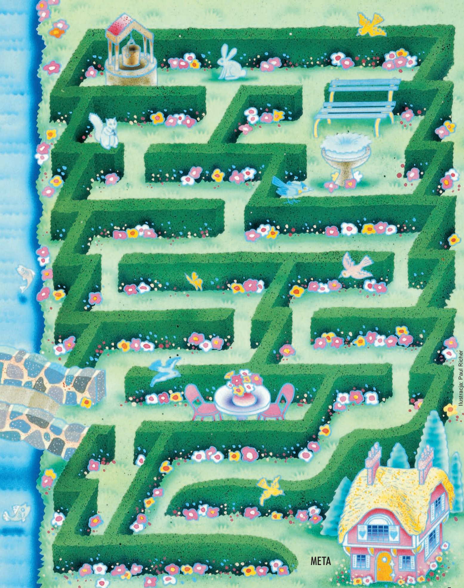
Ilustración: Paul Richer